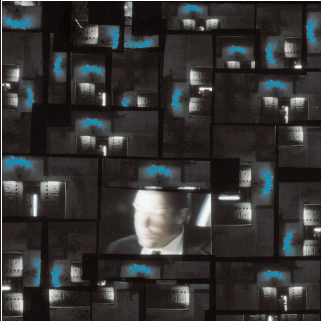
Silencio (2009) - 1,4 x 1,4 m