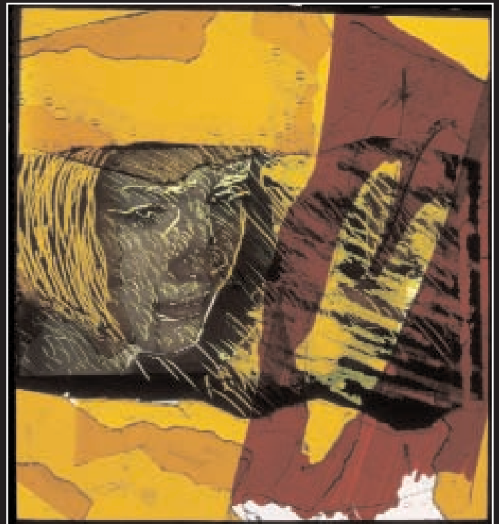
M'aime (2010) 1,4 x 1,5 m