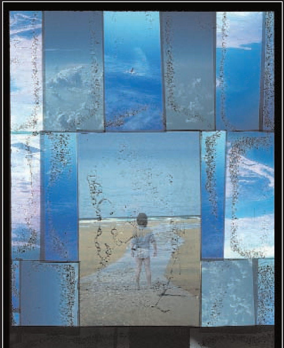
Ne parlons pas du manque (2003) - 1 x 0,80 m