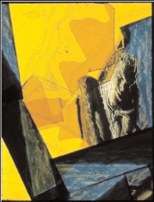
La cupidité des hommes (2010) - 1 x 1,4 m