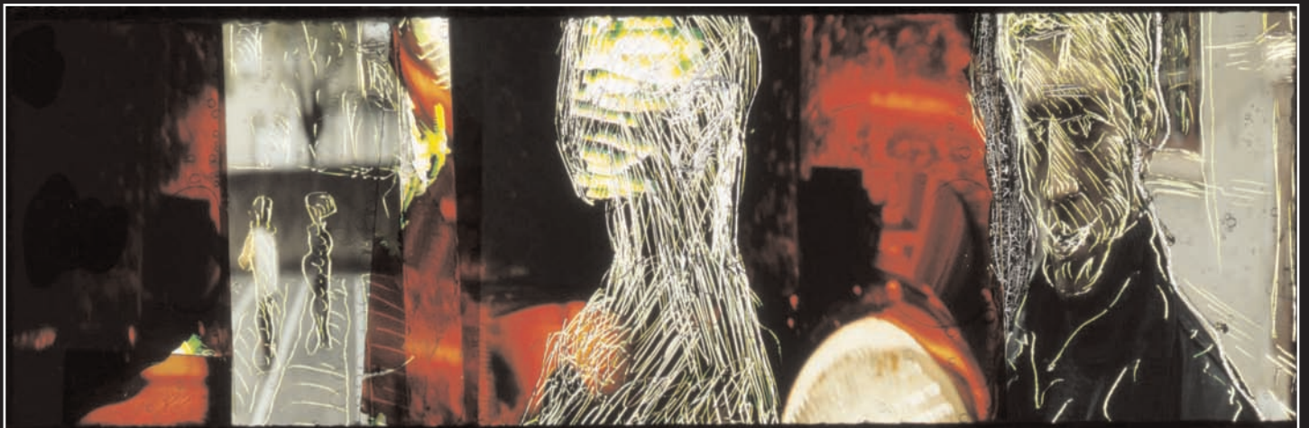
Accroché au mur (2010) - 0,6 x 1,9 m