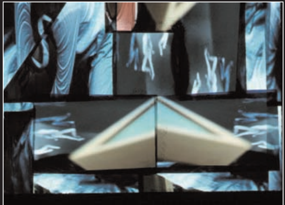
Raining in N.Y. (2007) - 1,4 x 2 m