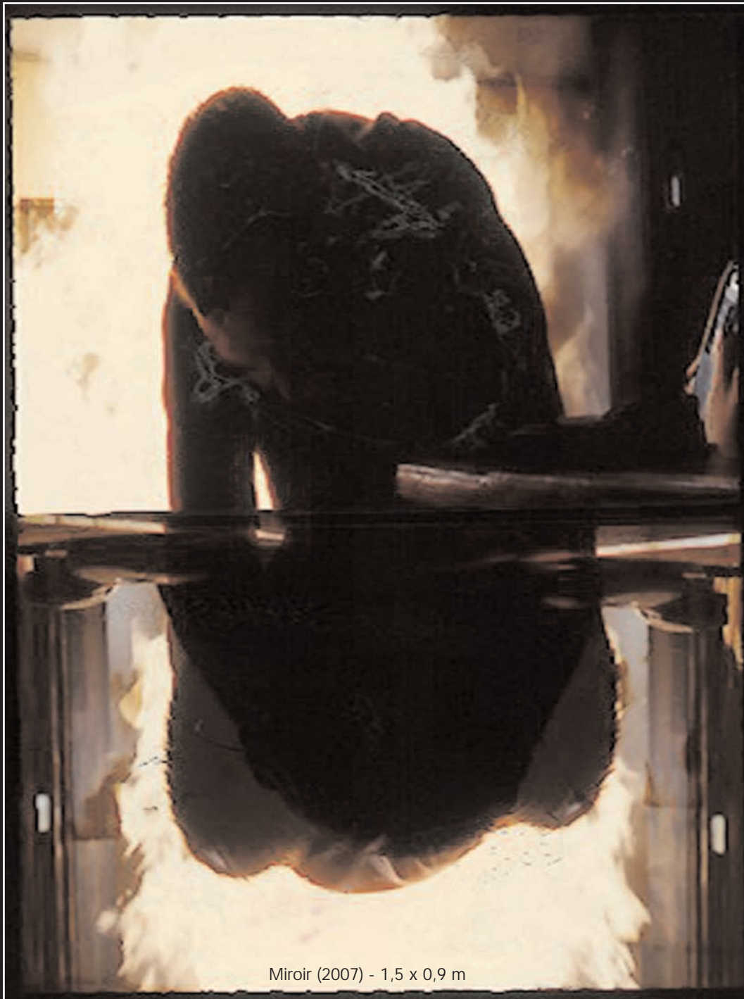
Miroir (2007) - 1,5 x 0,9 m